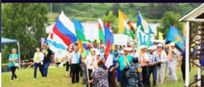
ТУРИСТИЧЕСКАЯ СПАРТАКИАДА СЕЛЬСКИХ ПОСЕЛЕНИЙ ПЕРМСКОГО КРАЯ