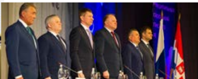
XII СЪЕЗД СОВЕТА МУНИЦИПАЛЬНЫХ ОБРАЗОВАНИЙ ПЕРМСКОГО КРАЯ