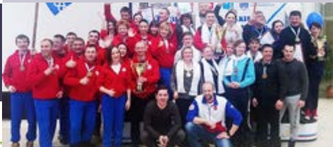
СПАРТАКИАДЫ СЕЛЬСКИХ И ГОРОДСКИХ ПОСЕЛЕНИЙ