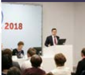
УЧАСТИЕ В КРАЕВОМ ОБЩЕСТВЕННОМ ФОРУМЕ – 2018