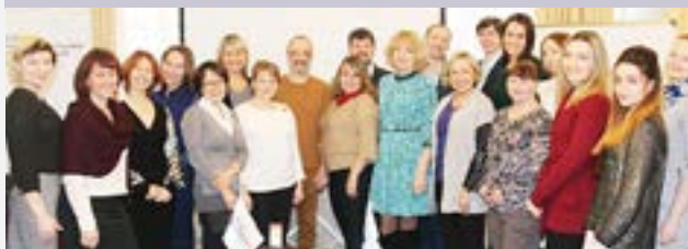
11 ВСТРЕЧ участников программы «МУНИЦИПАЛЬНЫЙ ФАКУЛЬТЕТ»