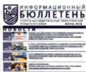
ВЫПУСК ИНФОРМАЦИОННЫХ БЮЛЛЕТЕНЕЙ