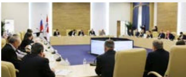
18 ЗАСЕДАНИЙ ПРАВЛЕНИЯ СОВЕТА МУНИЦИПАЛЬНЫХ ОБРАЗОВАНИЙ ПЕРМСКОГО КРАЯ И ЗАСЕДАНИЙ ПАЛАТ СОВЕТА МУНИЦИПАЛЬНЫХ ОБРАЗОВАНИЙ ПЕРМСКОГО КРАЯ