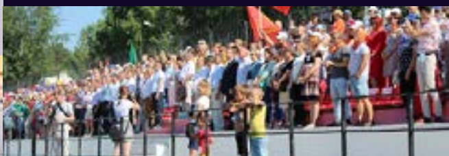
ПЕРВЫЙ РЕГИОНАЛЬНЫЙ ФОРУМ ТОС